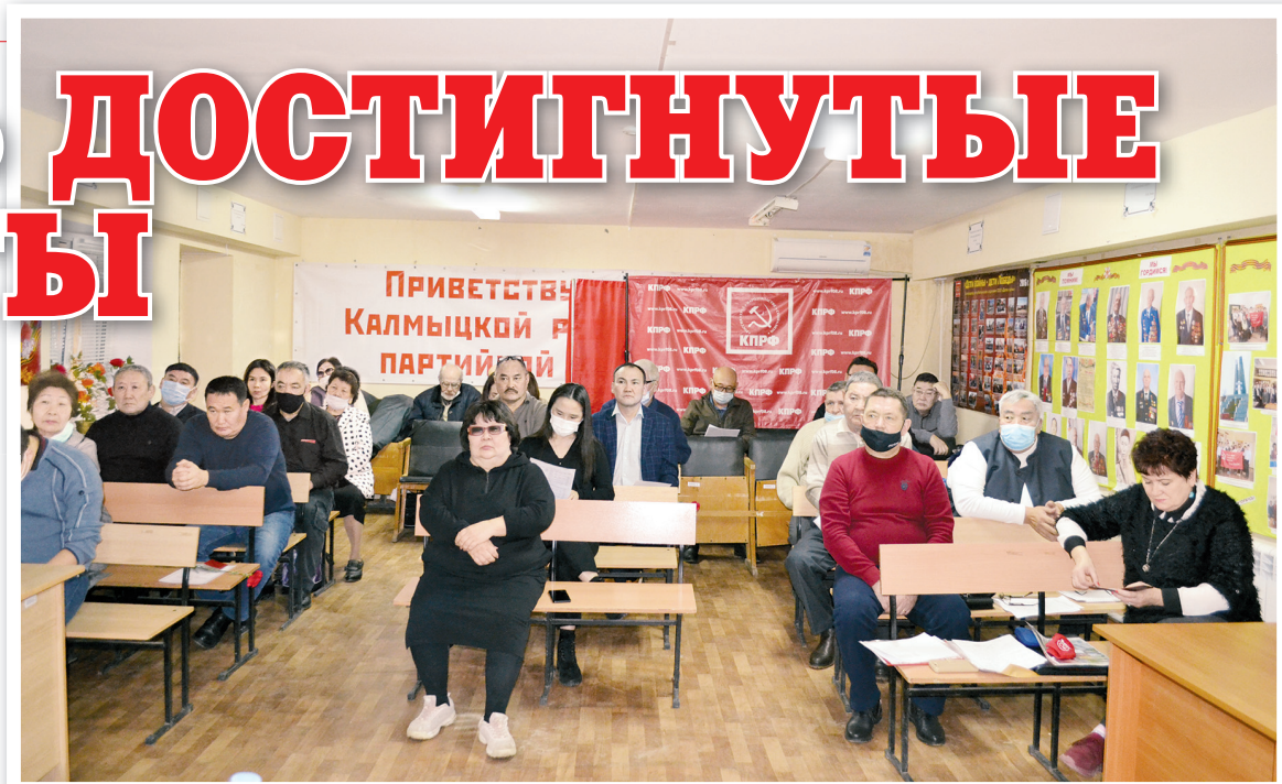
Участники совместного пленума Комитета и КРК КРО КПРФ