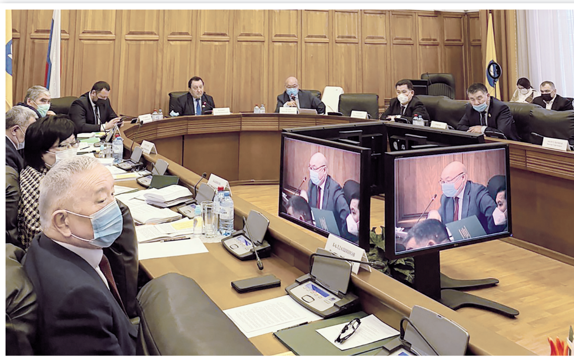
Зал заседаний парламента Калмыкии