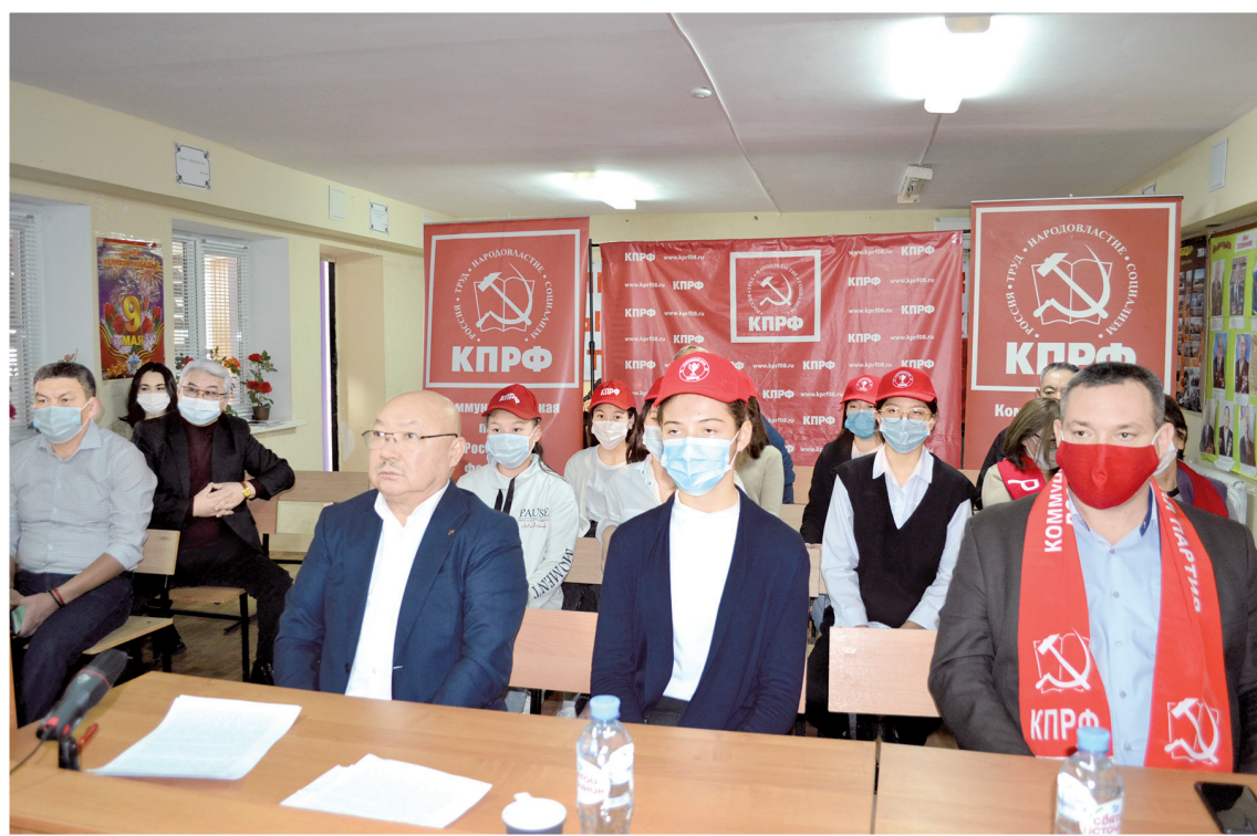
Партийный актив КРО ККРФ