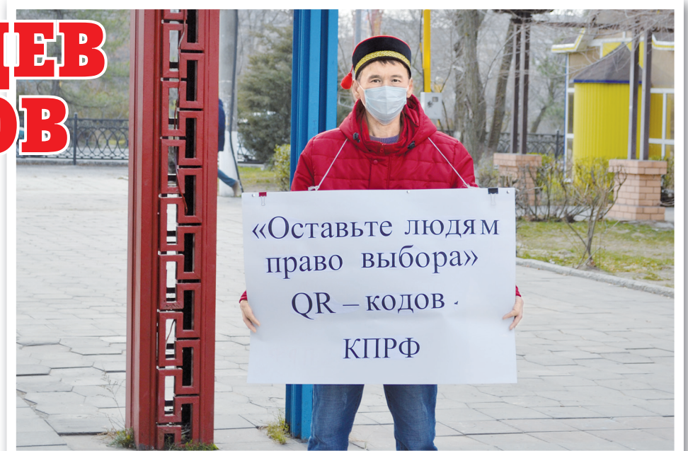
Пикет в Элисте. 23 ноября 2021 года

Калмыцкое республиканское отделение ПП КПРФ организовало в го-